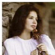
MISHEL BUSHKOVA Israël - Violon