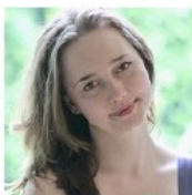
ELIANE MENZEL Allemagne - Violon