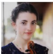
NAAMA BEN-ZAKEN Israël - Violon