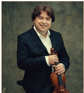
SERGEY OSTROVSKY Violoniste