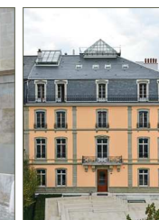
Conservatoire Populaire de Musique