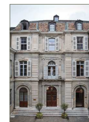
Société de Lecture

Au cœur de la Vieille-Ville de Genève, nous avons choisi la Société de Lecture , le Musée Barbier-Mueller et le Conservatoire Populaire de Musique pour organiser les masterclasses. Les jeunes talents y évoluent dans un cadre idyllique.