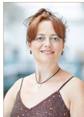
ANNEGRET KUTTNER Pianiste

Professeure de piano à la Haute Ecole de Musique de Leipzig