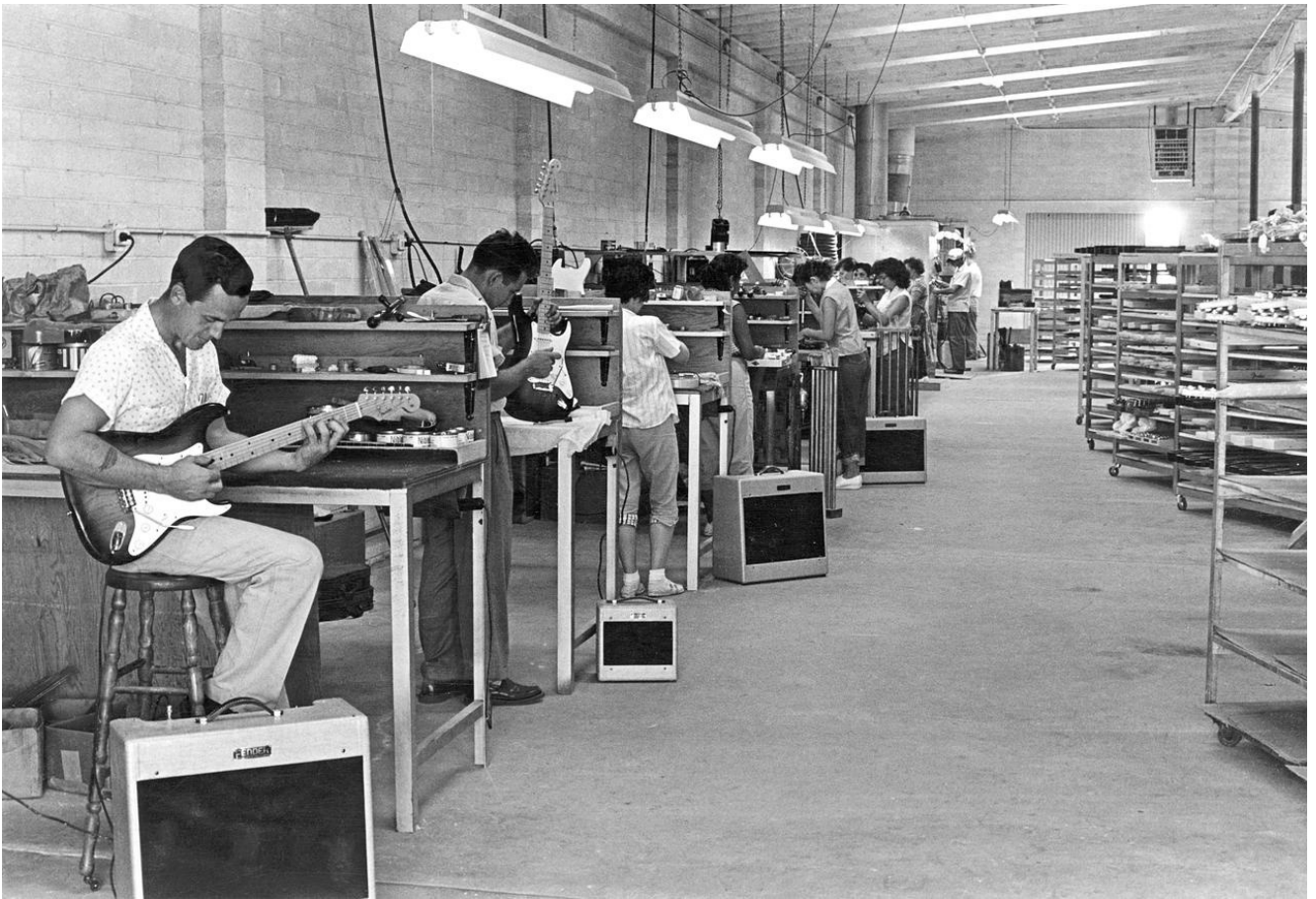
Des ouvriers fabriquent des Stratocaster dans une usine de Fender en 1955. [FENDER]