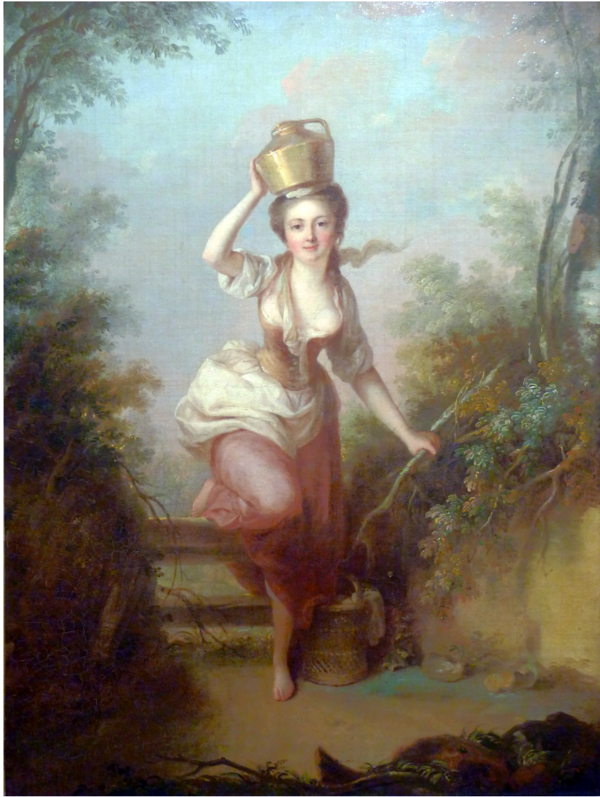
Jean-Baptiste Huet (1745 - 1811)