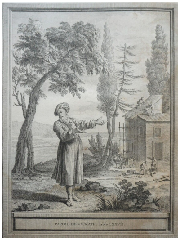
Jean-Baptiste Oudry, né à Paris le 17 mars 1686 et mort à Beauvais le 30 avril 1755, est un peintre et graveur français. Il est surtout célèbre pour ses peintures de chiens de chasse, ses natures mortes animalières et ses animaux exotiques.